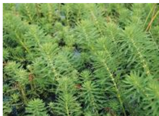
Tiges de Myriophylle du Brésil

→ En France, l'arrêté du 2 mai 2007 interdit la commercialisation, l'utilisation et l'introduction dans le milieu naturel des Jussies : Ludwigia grandiflora et L. peploides .