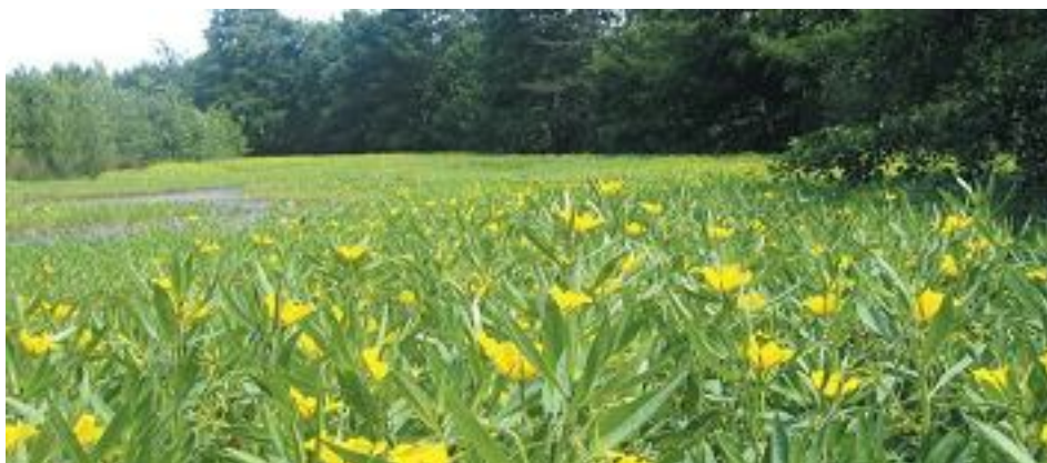
Invasion d'un lac par une Jussie