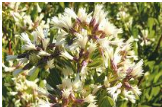
Graines à aigrettes du Sénéçon en arbre