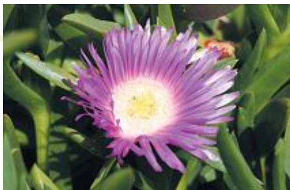
Fleur de griffe de sorcière